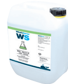
ref. 062511 Líquido de refrigeración especial soldadura - 5 l