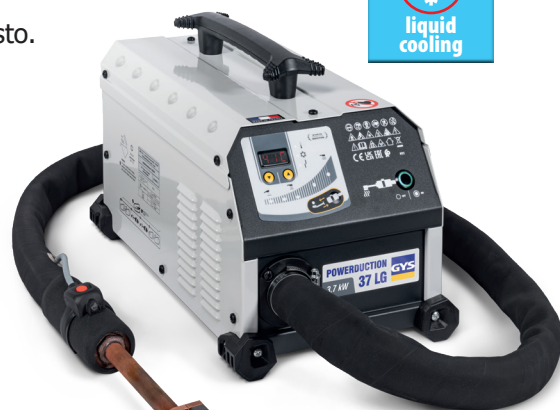
Generador entregado completo y ya montado, con 1 inductor de calentamiento de 90°.