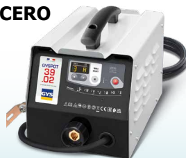
EASYLINER 39.02 - ref. 053618