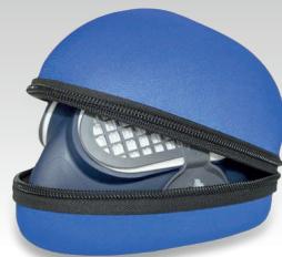
Estuche para almacenado 037045