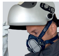
Eficacia de filtración de polvo (0,6 µm)