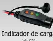
Indicador de carga 56 cm