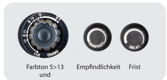
Farbton 5>13 und Schleifmodus