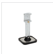
Fuß für Zugbrücke (kurz) Art.-Nr. 059320