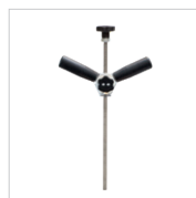
Zughebel für Zugbrücke Art.-Nr. 059399