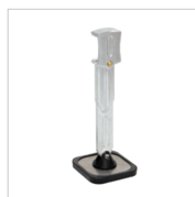
Fuß für Zugbrücke (lang) Art.-Nr. 059337