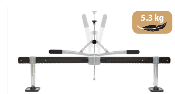
Zugbrücke Premium - 1200 mm Art.-Nr. 059313