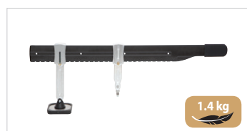
Zughebel Premium Art.-Nr. 059290