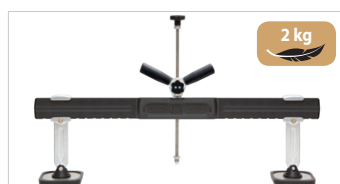
Zugbrücke Premium Art.-Nr. 059306