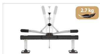
Zugbrücke premium Art.-Nr. 058996