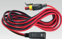
Erweiterungen 2.5 m - 029057