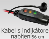
Kabel s indikátorem nabíjení 56 cm