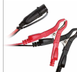
Скоби (45 cm)